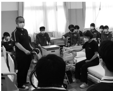
「生活支援技術」(演習)