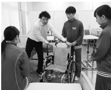
「生活支援技術」(演習)