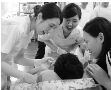
養護学校での口腔ケア

心理学、口腔解剖、衛生学・公衆衛生学、衛生統計学、地域保健学、衛生行政・社会福祉、歯周治療学(Ⅱ)、口腔外科学、高齢者歯科学、歯科放射線学(Ⅱ)、歯科英語、実用英語、歯科予防処置法(Ⅱ)、歯科保健指導(Ⅱ)、歯科診療補助法(Ⅱ)、主要歯科材料(Ⅱ)、臨床検査・救急蘇生法、臨床実習(Ⅰ)、臨地実習(Ⅰ)、マナーⅡ(ビジネスマナー)、食育学、看護学、歯科口腔介護学、歯科マネジメント等