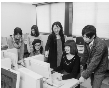
スキルアップのための徹底した個別指導

アパレル産業の現場ではファッションの基本技術はもちろん、「IT」(PCスキル)が必要とされています。デザインのみならず企画提案までを実践に合せたPCスキルを修得します。