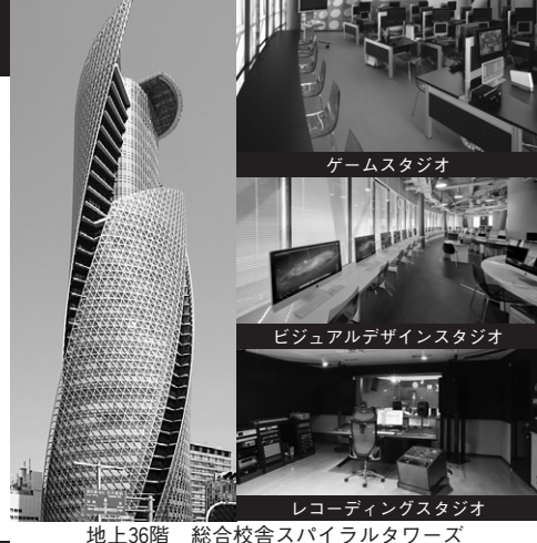
地上36階 総合校舎スパイラルタワーズ