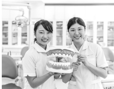
「就職に強い、医療職！ 歯科衛生士を目指そう！」

8階建ての校舎は歯科医療の現場に対応した本格的な実習環境が整っています。2つの実習室にはキレイな歯科診療台を計30台配置し、一人ひとりが実践力を身につけることができます。