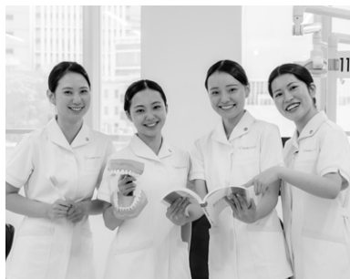
「就職に強い、医療職！ 歯科衛生士を目指そう！」

8階建ての校舎は歯科医療の現場に対応した本格的な実習環境が整っています。2つの実習室にはキレイな歯科診療台を計30台配置し、一人ひとりが実践力を身につけることができます。