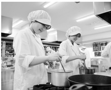
実践力を養う実習

の広がりとともに学びの裾野も広く設定し、調理、栄養、食品だけでなく、医学、衛生学におよぶ多彩な科目を体系的に学びます。学習スタイルは基礎から応用と順に学び進めるように工夫され、演習活動を通して他者とのコミュニケーションを図りながら物事を成し遂げられる力も養います。