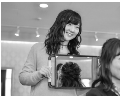
自分に合ったサロンを見つける事ができます

◇ 本校独自のシステム“週末サロンワーク” 【Point 1】在学中から経験を積み、ヘアスタイリストへの近道に。 【Point 2】自分に合った就職先を見つけられる！ 【Point 3】お給料がもらえる！自分の力で学費軽減！ *週末サロンワークとは、本校の後援会サロンにて週末(土日祝)にアシスタントとしてアルバイトができるシステムです。