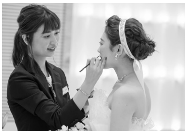
業界のプロフェッショナルを育成します。

〔ブライダルスタイリストコース〕では、花嫁のこだわりを誠実に応えられるブライダルスタイリストを育成します。メイクやネイルを併せて学ぶため、ビューティー全般について花嫁にアドバイスができ、幅広く活躍できる力が身に付きます。