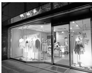
校内ショップ(本校1階)学生のブランド商品販売

服飾専門学校（2年）、短大・大学（被服系）の卒業生が編入学でき、アパレルデザインコース・アパレルパターンコースに分かれ、グレードの高いクリエイターとして能力を発揮できる人材を育成するコース。