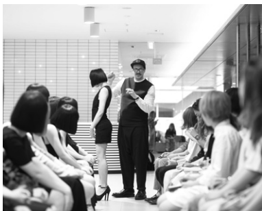
SASSOONスクールシップ認定校