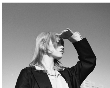
ひかりの方へ、顔を上げて。

理美容甲子園 東海大会2025出場校最多入賞20名、SPC STYLING COLLECTION全国大会2025 学生ワインディング種目：優秀賞、ユーカリジャパンDesigners Award2025優秀賞、CHUBU HAIR STYLE AWARDS2025グランプリ、FUTURE TOKAI2025準グランプリ、FEATHERレザーカットコンテスト2023グランプリ、三都杯デザイナーズコンテスト2025優秀賞 ほか多数