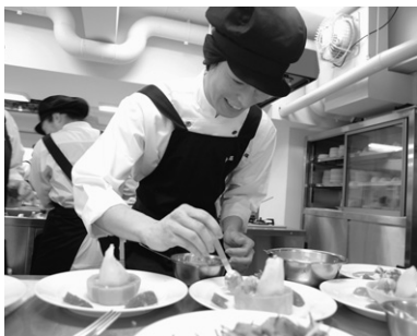
楽しい調理実習の様子