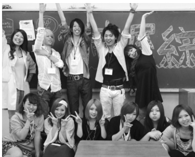
体験入学では在校生たちがおもてなし。

オープンスクールでは、Sobiの在校生がコンシェルジュとして高校生の皆さんに対し優しくフォローいたします。そんな在校生には対応マニュアルが一切ないのでSobiの良さを直接見て聞いてご理解いただけたらと思います。