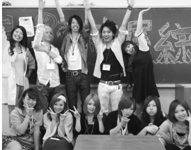
体験入学では在校生たちがおもてなし。

4/29(祝)、5/23(日)、6/5(土)、6/20(日)、7/17(土)、8/22(日)、9/11(土) すべて13:00~15:00に開催。 学生の皆さん、みんな私服でお気軽に遊びに来てくださいね。 (Sobiは大きい学校ではないので一応、予約制になります。)