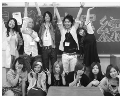
体験入学では在校生たちがおもてなし。

5/26(日)、6/23(日)、7/21(日)、8/25(日)、9/29(日)、10/27(日) 学生の皆さん、みんな私服でお気軽に遊びに来てくださいね。 (Sobiは大きい学校ではないので一応、予約制になります。)