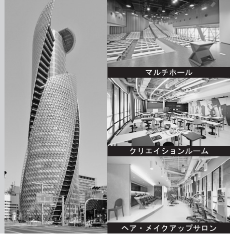
地上36階 総合校舎 モード学園スパイラルタワーズ