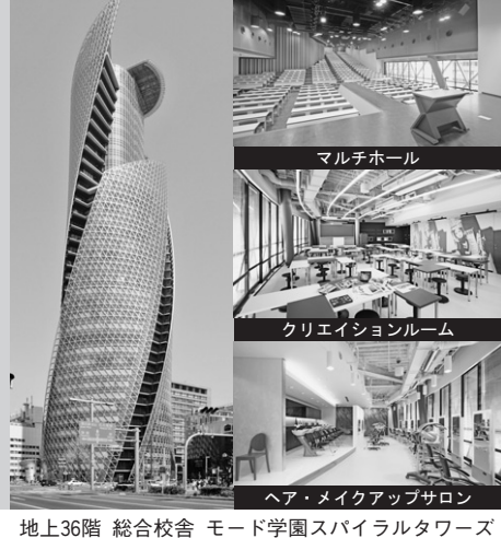
地上36階 総合校舎 モード学園スパイラルタワーズ