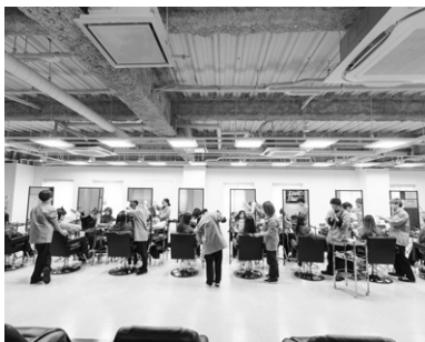
みんな大好き相モデル実習