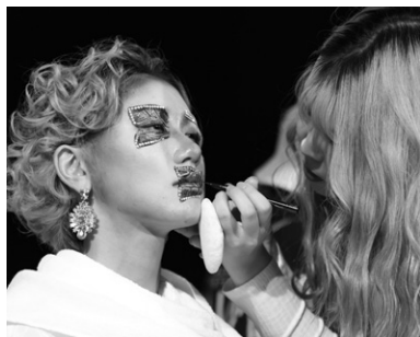
日頃の成果を発揮する学園祭