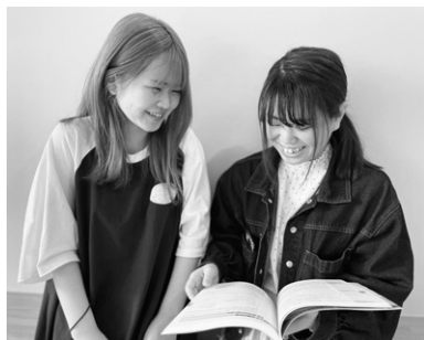
駅チカ☆キョリチカ☆夢チカ!