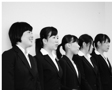
自信を持って社会に出よう

入学前に取得した資格によって入学金や施設費を減免する制度があります。また、一人親家庭の学生対象の「一人親家庭減免制度」もあります。希望する方は、学費の6回分納も可能です。