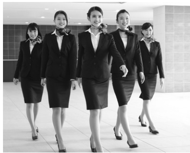
表現力を磨き、魅力ある人材に育てます。