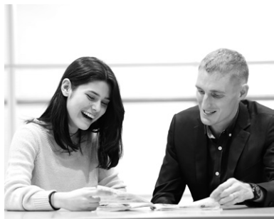
外国人講師による実践的な授業

ホテルスタッフの基本に加え、実際に1年次後期にテーマパークホテルでインターンシップに参加することで、お客様に楽しさや感動を与えられるホスピタリティも身につけます。