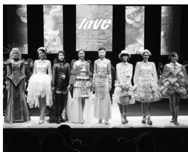
ファッションショーフィナーレ

本校の最大行事はファッションショー。毎年学生たちが実行委員会を組織し、時代に合わせたテーマを決め、そのプレゼンテーションに基づき、出品者は約2カ月全力投球で制作した作品を発表し、一般来場者のほかアパレル業界の方々や報道関係者など、観客全員の投票により、最高得票獲得者には愛知文化ファッション大賞が、上位入賞者には奨学金が授与される褒賞制度があり、学生の大きな励みになっています。また、毎年、業界紙や東京の