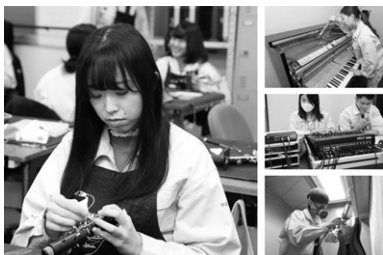
総合的に学び、舞台・ピアノ国家検定が取得可能

【学び】3年制学科で学び、進路先の幅を広げます。ピアノ調律や整調技術、管楽器・ギター・バイオリンのリペア技術や販売知識、電子楽器の知識、舞台音響の技術などを2年前期までで効率的に習得。後期から専攻コース（鍵盤、管、舞台・ギター）を選び、希望進路に合わせた専門性を高めます。【進路】ピアノや管打楽器、ギター、バイオリン、電子楽器などの知識・技術を活かし、楽器のメーカーや商社、楽器店、修理工房など、全国各地で活躍できます。さらに、舞台音響制作、イベントスタッフ、コンサートプロモーターなど、音楽サービスの仕事も多彩で、未来の可能性が広がっています。