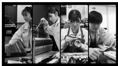
総合的に学び、舞台・ピアノ国家検定が取得可能

【学び】3年制学科で学び、進路先の幅を広げます。ピアノ調律師や整調技術、管楽器・ギター・バイオリンのリペア技術や販売知識、電子楽器の知識、舞台音響の技術などを2年前期までで効率的に習得。後期から専攻コース（鍵盤、管、舞台・ギター）を選び、希望進路に合わせた専門性を高めます。【進路】ピアノや管打楽器、ギター、バイオリン、電子楽器などの知識・技術を活かし、楽器のメーカーや商社、楽器店、修理工房など、全国各地で活躍できます。さらに、舞台音響制作、イベントスタッフ、コンサートプロモーターなど、音楽サービスの仕事も多彩で、未来の可能性が広がっています。