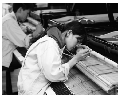
総合的に学び、舞台・ピアノ国家資格が取得可能

～入学後に進路を見据えたコース選択ができる～ 1・2年次はピアノや管楽器などのアコースティック楽器はもちろん、デジタル楽器までの基礎を学び、舞台実務を含む知識と演習にて実践的な総合力を身につけていきます。3年次は、将来を見据えてピアノや管打楽器、ギター、バイオリンから専門技術習得分野を選べます。