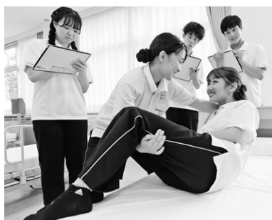
授業風景「生活支援技術」

あなた自身のやりたいことや個性に合った就職先が見つかるように、一人一人をサポートします。