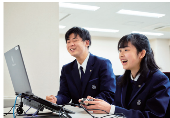
ドローンやeスポーツの大会に出場予定!!