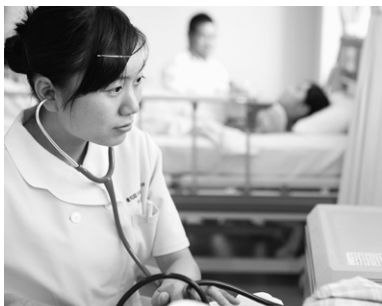
現場に即した実技指導