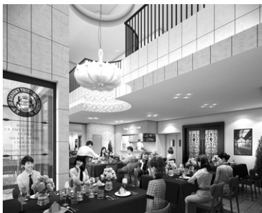
レストラン実習室

本校では、学生1人の就職活動を2人以上の先生がサポートします。また、毎週実施しているキャリアデザイン（就職指導）の授業では、履歴書の記入方法から面接対策まで学ぶことができ、一人ひとりの希望や個性に合う就職先へ導きます。