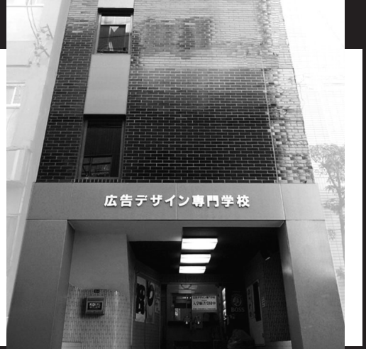
広告デザイン専門学校