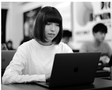
個性を生かし、社会へと活かす教育環境。

小さな学校だからこそ生まれる家族的な環境は、目標に向かって団結する温かい連帯感を作り出しています。