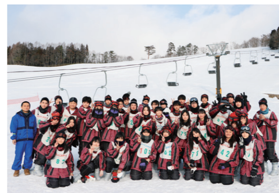
1年次の宿泊研修はスキー実習！学級集合写真

サッカー部、バスケ部、バレーボール部、軟式野球部、卓球部、陸上競技部、eスポーツ部、軽音学部、ほか