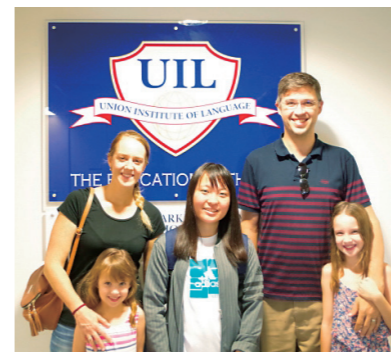
留学は初心者から帰国子女まで対応できる多彩なプログラムを用意しています。