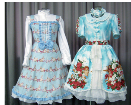
出来上がった作品