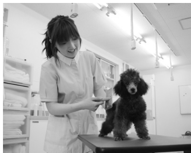
グルーミング実習