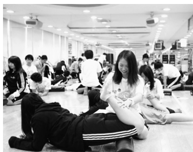
授業風景「コンディショニングの理論と実際」

短期大学との併修により「保育士」「幼稚園教諭二種」の国家資格をダブル取得し、スポーツ指導もできる保育者を目指す。