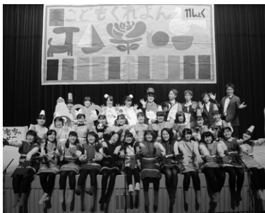
学んだ成果を発表する「保育発表会」

子どもだけでなく、周りを取り巻く大人たちの心理や環境も理解した保育者のプロをめざします。国家資格である保育士資格を2年間で取得するため密度の濃い2年間を送ることができます。また、希望者は、幼稚園教諭免許取得課程を併修することができ、幼稚園教諭二種免許も取得できます。2026年4月より、保育士コースに午前通学スタイルを開設。