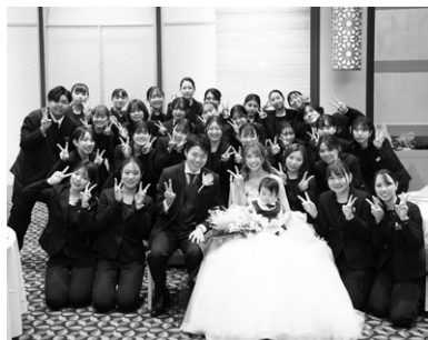
学生が「本物の結婚式」の全てをプロデュース

挙式や披露宴の企画・演出から料理・ドレス・ヘアメイクとあらゆるブライダルシーンをトータルでプロデュースする力を実践的に身に付け、二人の結婚式を人生で最高の瞬間にする人材を育てます。1年次後期から“ハウスウェディング”“ホテルウェディング”“ブライダルフォト・ムービー”