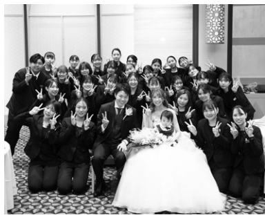
学生が「本物の結婚式」の全てをプロデュース

挙式や披露宴の企画・演出から料理・ドレス・ヘアメイクとあらゆるブライダルシーンをプロデュースする力を実践的に身に付け、二人の結婚式を人生で最高の瞬間にする人材を育てます。2年次から「ハウスウェディング/ホテルウェディング/ブライダルフォ