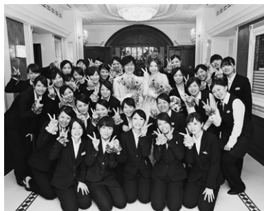
学生が「本物の結婚式」の全てをプロデュース

挙式や披露宴の企画・演出から料理・ドレス・ヘアメイクとあらゆるブライダルシーンをトータルでプロデュースする力を実践的に身に付け、二人の結婚式を人生で最高の瞬間にする人材を育てます。1年次後期から「ハウスウェディング」「ホテルウェディング」に特化したコース