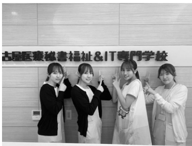
楽しい学校生活と安心の実績

WEBデザイナーとしての確かな知識・技術を裏付ける「ウェブデザイン技能検定」や国家資格「ITパスポート」の取得をはじめ様々な資格とITビジネスのスキルを活