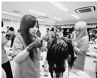
即戦力につながる「サロンワーク」

美容師の国家資格取得を目指す学科です。1年次前期は基礎を学習し、1年次後期に5つのコースから1つを選択し、各コースに特化した授業を履修します。2年次後期からは、国家試験対策を集中的に実施し、国家資格合格を目指します。