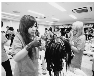
即戦力につながる「サロンワーク」

美容師の国家資格取得を目指す学科です。1年次前期は基礎を学習し、1年次後期に5つのコースから1つを選択し、各コースに特化した授業を履修します。2年次後期からは、国家資格対策を集中的に実施し、国家資格合格を目指します。