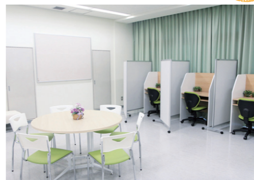
カウンセラーは毎日学校にいるので、気軽にお話しできます。