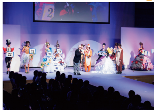
Sobiヘアフェスティバルでの熱い戦い