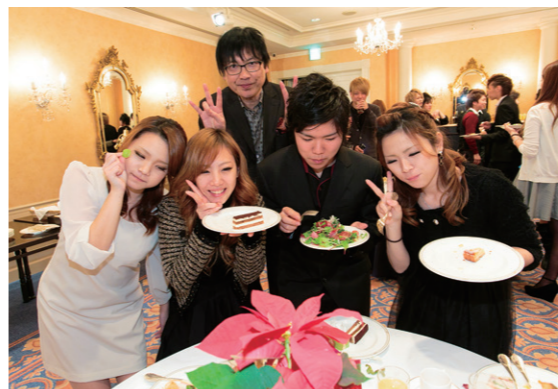
クリスマスパーティーでみんな盛り上がります