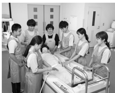
生活支援技術の授業風景

高齢者・障害者の日常生活を幅広く支援するためのスペシャリストが介護福祉士です。確かな技術と知識を身につけていくために、「学ぶ→実践する→共有する」のサイクルで行う少人数のゼミナール形式の授業で着実にステップアップができるよう、一人ひとりにきめ細かな教育サポートを実施しています。