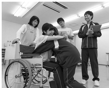
生活支援技術の授業風景

高齢者・障害者の日常生活を幅広く支援するためのスペシャリストが介護福祉士です。確かな技術と知識を身につけていくために、「学ぶ→実践する→共有する」のサイクルで行う少人数のゼミナール形式の授業で着実にステップアップができるよう、一人ひとりにきめ細かな教育サポートを